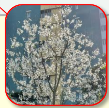
21.コブシ 早春の光に輝く白い花 花3-4月