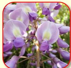
20.フジ 甘い香りと優美な姿 花5月